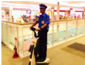
「パーソナルモビリティを活用した警備スタッフの館内巡回」