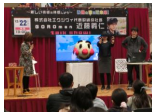
「未来の映像」トークショー