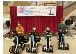
「アイリーエーアイ」体験試乗会