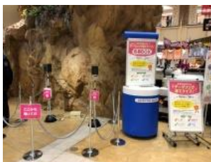
指向性スピーカーを活用したクイズ