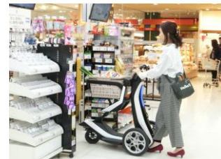
「アイリーエーアイ」カートモードでの買い物実証実験