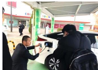
エコ充電キャンペーン