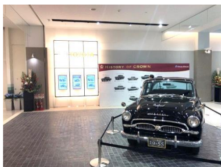
初代クラウンを展示