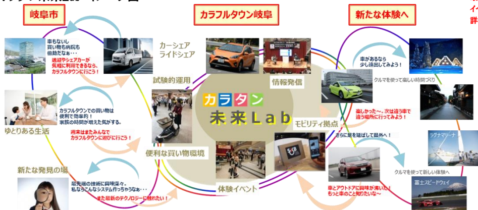
■カラタン未来Lab イメージ図

※4・・・モビリティやロボティクス並びにAIやVR等の最新テクノロジーを活用した各種実証実験やイベントの実施を継続的に展開中。詳細はカラフルタウンHPをご参照ください。