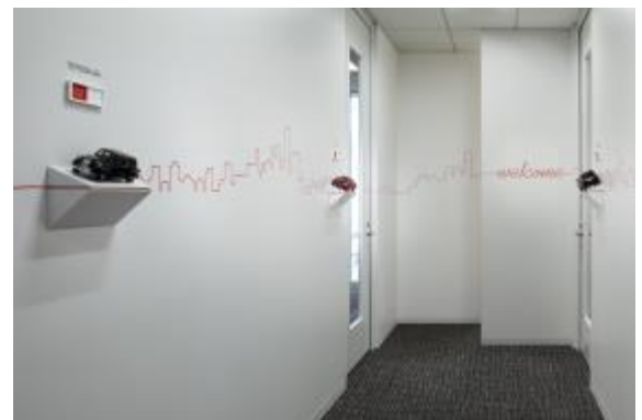
その他の応接室・会議室にも、様々な願いや 想いを込めて、代表的な車種の名前を設定