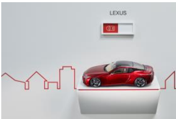
‘本物’を作ることに‘本気’で取り組む施設を 持ち続けたいと願いを込めた「レクサス応接室」