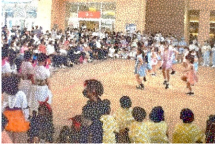
＜夏祭り・盆踊りの様子＞