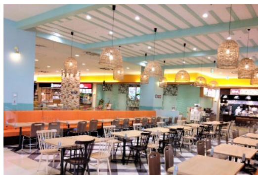
＜改装後のフードコート客席＞

ゴールデンウィークを控えた4月28日には、15周年リニューアルグランドオープンとして南棟1階にスイーツの名店が揃う食物販ゾーン「ソレイユマルシェ」、青果専門店の「フレッシュダイトー」、ライフスタイルショップの「ラコレ」、ピースソファの「ヨギボーストア」、靴下・インナーの「チュチュアンナ」と、お客さまからのニーズの多かった店舗が続々とオープンいたします。