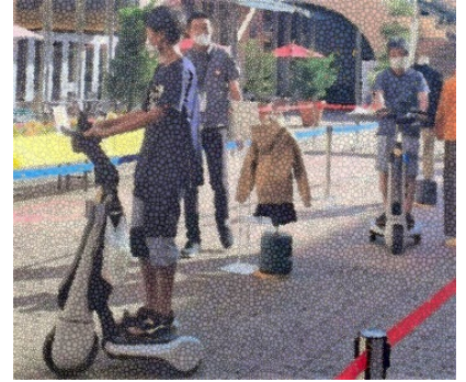
＜次世代モビリティ体験会＞