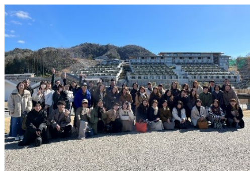
＜ES施策・他施設視察バスツアー＞