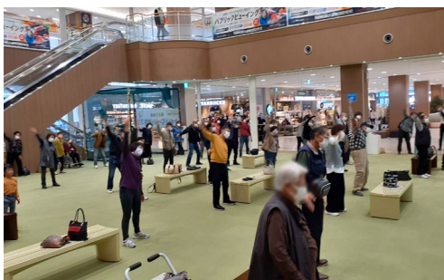
＜カラタンラジオ体操の様子＞

テナントとの取り組みでは、テナント間でのコラボ企画を支援するコラボ販促コンテストを実施。テナントから立案されたイベント計7企画を採用し、お客さまの買い回り促進に取り組みました。